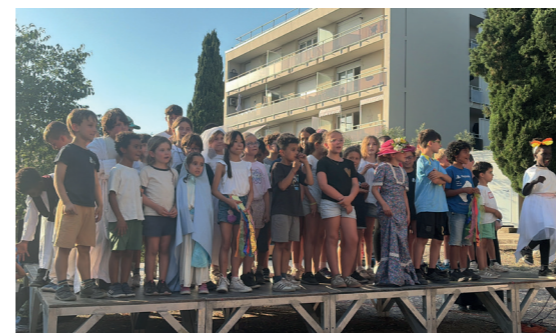
Magnifique spectacle présenté par les enfants du patronage