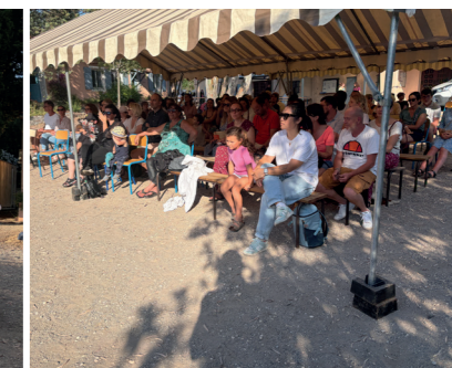
Un public enthousiaste devant les prestations des enfants