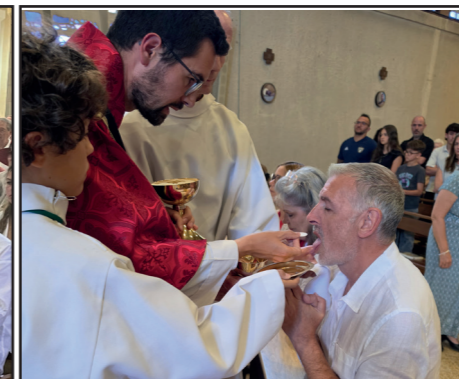
Première communion des adultes à Notre-Dame de la Paix