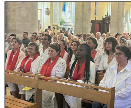
Première communion des adultes à Notre-Dame de la Victoire