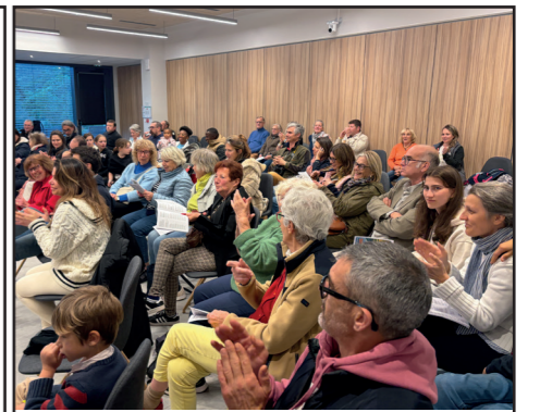
Vacances paroissiales à Notre-Dame du Laus