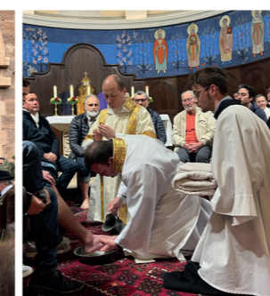
Lavement des pieds "Faites ceci en mémoire de moi"