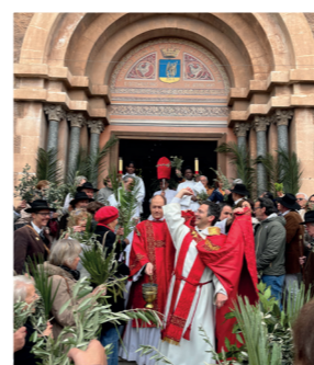
Bénédition des Rameaux "Hosanna au plus haut des cieux!"