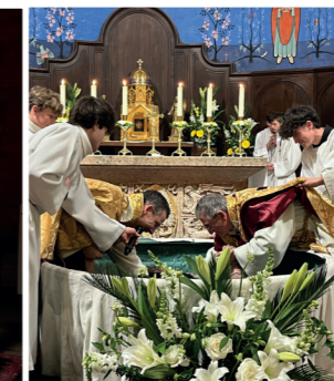
Baptêmes par immersion "Je te baptise au nom du Père du Fils et du Saint Esprit"