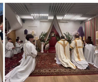
Au reposoir "Veillez et priez pour ne pas entrer en tentation"