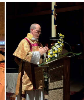
Chant de l'Exultet "Exultez dans le ciel, multitude des anges !"