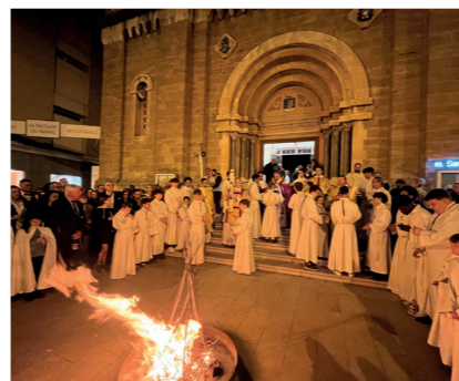
Feu nouveau "Lumière du Christ ! Nous rendons grâce à Dieu "