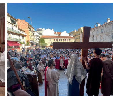
Chemin de croix dans la ville "Père, pardonne-leur, ils ne savent pas ce qu'ils font"