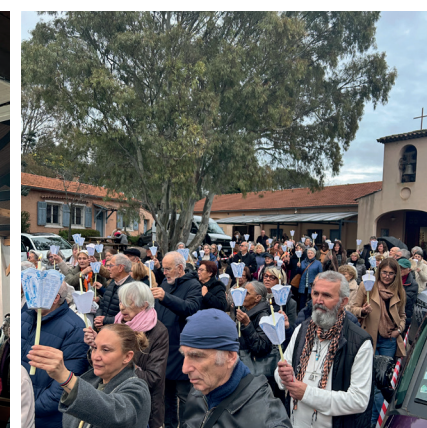
Traditionnelle procession vers la grotte