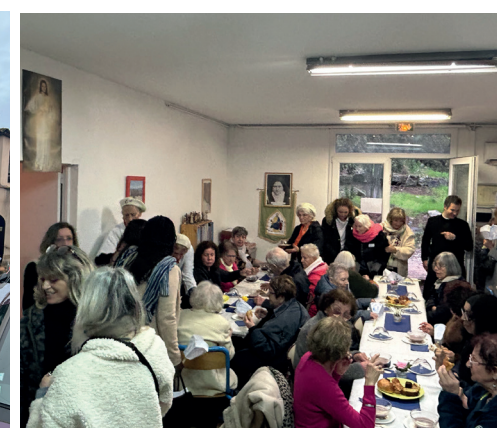
Un réconfortant goûter partagé entre tous