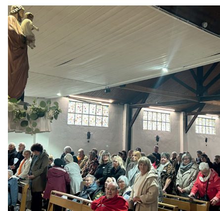
De nombreux malades ont reçu la bénédiction ou le sacrement des malades