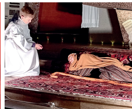
A Notre-Dame de la Paix