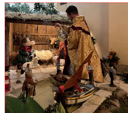
A Notre-Dame de la Victoire