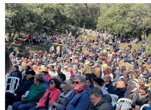
Belle messe en plein air animée par les enfants du patronage