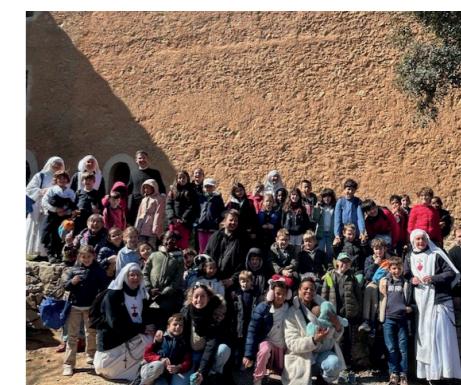
Les enfants du patronage à la source de Saint Joseph