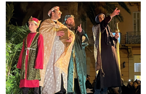
aux bergers venus l'adorer à la crèche, au roi Hérode renseigné par les Rois Mages venus de pays lointains pour s'incliner devant le Sauveur