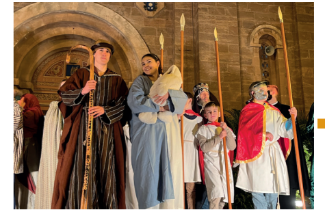
De l'édit, commandant le recensement de la population, au départ de Marie et Joseph à Bethléem, de la naissance de Jésus...