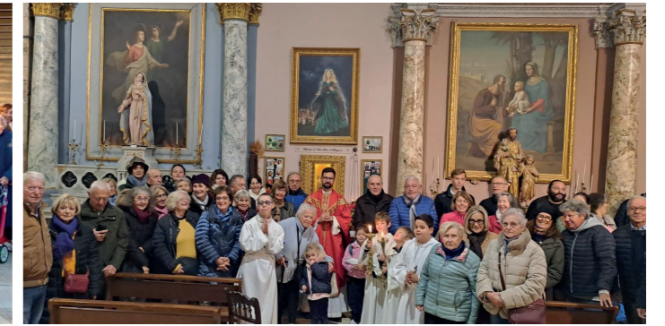
A Bargemon avec la paroisse Notre-Dame de la Paix