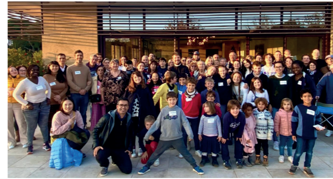
Au Clos des Roses avec la paroisse Sainte-Bernadette