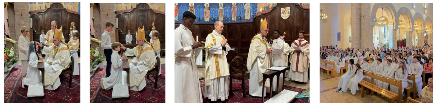
Cette année la confirmation s'est déroulée en deux fois pour les 51 jeunes de l'Institut Stanislas et de l'Aumônerie.