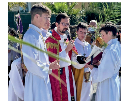
À Notre Dame de la Paix