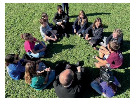
Réflexion avant le départ du Push Car