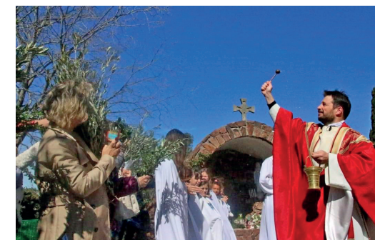
Dans la cour de Sainte-Bernadette