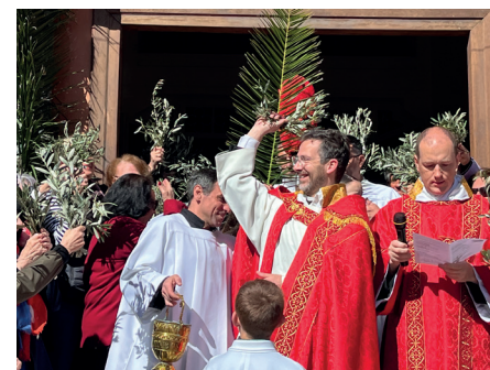
Sur le parvis de la Basilique