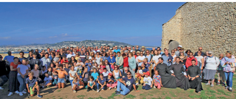
Après le grand jeu que petits et grands attendaient avec impatience (égalité entre les deux équipes) la magnifique photo de groupe