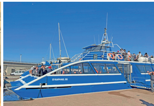
Puis direction " le vieux port" pour embarquer sur un bateau bleu direction l'île Sainte Marguerite