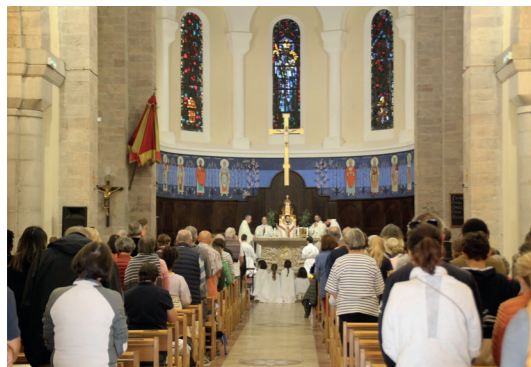
Tout commence par la Messe dite à la Basilique