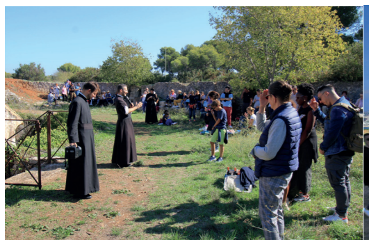
A notre arrivée sur l'île un pique-nique partagé fut agréablement accueilli après le bénédicité