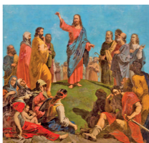
La moisson est abondante, mais les ouvriers sont peu nombreux.

PÈLERINAGE DU ROSAIRE Lundi 3 octobre 2022 au samedi 8 octobre 2022 Les bulletins d'inscription sont disponibles au presbytère de la Basilique Contact : Elyane Foullonneau 06 63 75 73 20