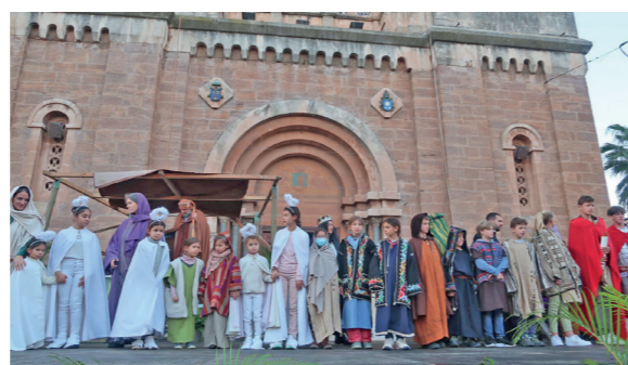
Au final, salutation de tous les acteurs sous les applaudissements des spectateurs ravis