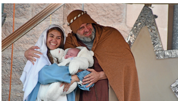
La Sainte Famille : Marie, Joseph et Jésus