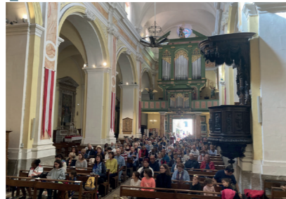
L'église Notre-Dame de l'Assomption nous a reçus pour la célébration de la Messe