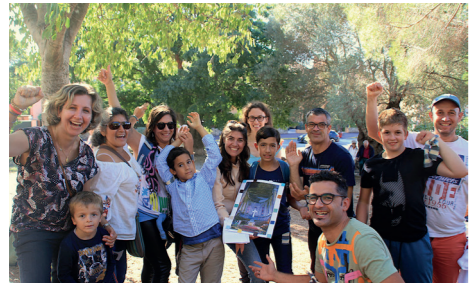
L'équipe gagnante du grand jeu