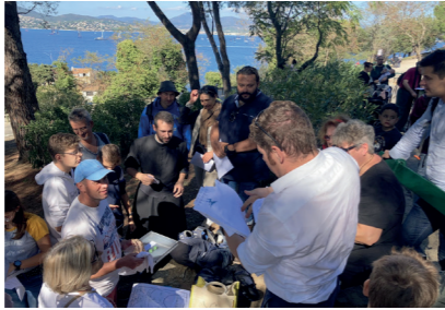
Préparation et mise en place du grand jeu