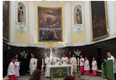
par nos prêtres, en présence de nombreux enfants de chœur et servantes de Jésus