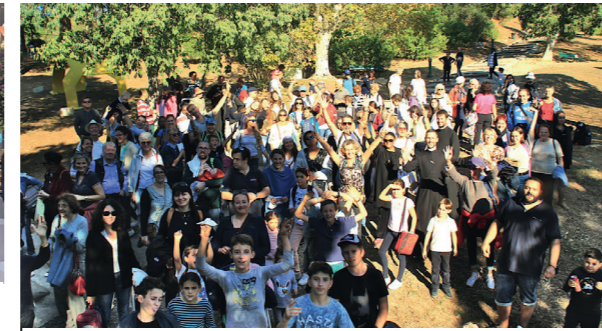
Photo souvenir de ce merveilleux jour, Deo gratias

Dans le cadre d'une rencontre diocésaine