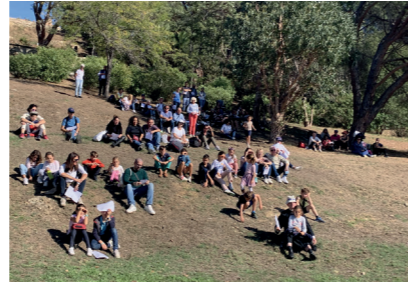
Sélection des huit équipes pour savoir qui va jouer avec qui et contre qui