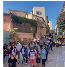
Déambulation dans les rues de Saint Tropez