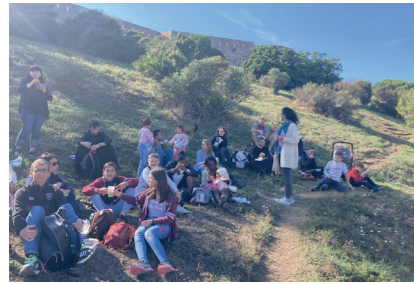
Pique-nique face à la mer, un régal pour les papilles et pour les yeux