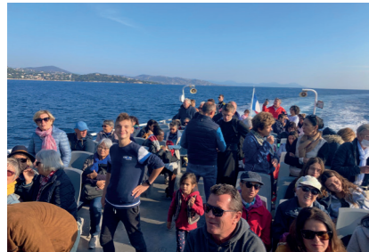
Grand départ pour Saint-Tropez, le bateau est complet