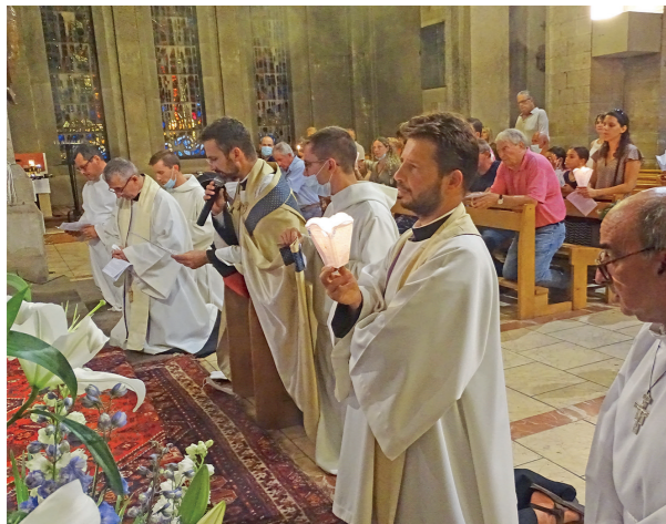
Lecture du vœu de Louis XIII à la Vierge Marie où il s'engage à consacrer le royaume de France à Notre Dame