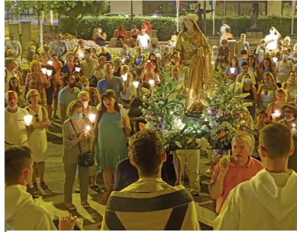
Retour de Notre Dame à la Basilique