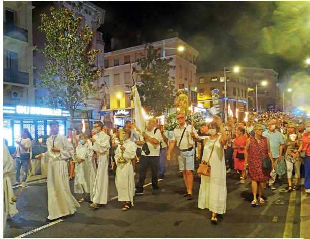
La procession s'est élancée dans les rues de Saint-Raphaël au rythme du chapelet et des chants en l'honneur de la Vierge Marie