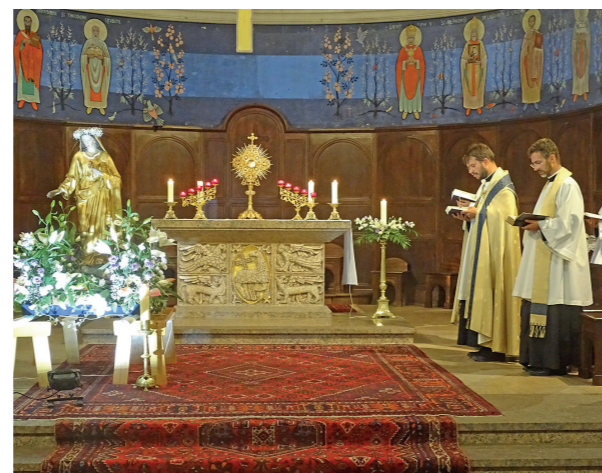
Vêpres et adoration en présence de la Vierge Marie