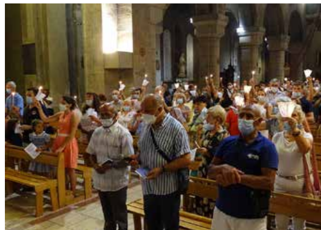
...Voeu de Louis XIII et prières en araméen pour clôturer cette belle procession