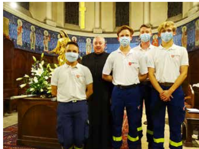
Quatre jeunes de l'ordre de Malte assuraient les secours