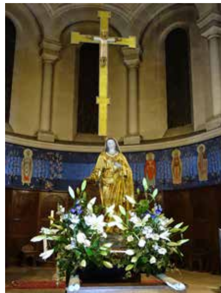
Notre-Dame magnifiquement fleurie au pied de la Croix