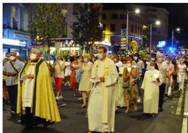
qui, au passage de la Vierge Marie, s'arrêtaient, écoutaient et priaient un instant