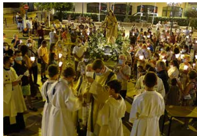
Retour à la Basilique pour un dernier chant accompagné par l'orgue...