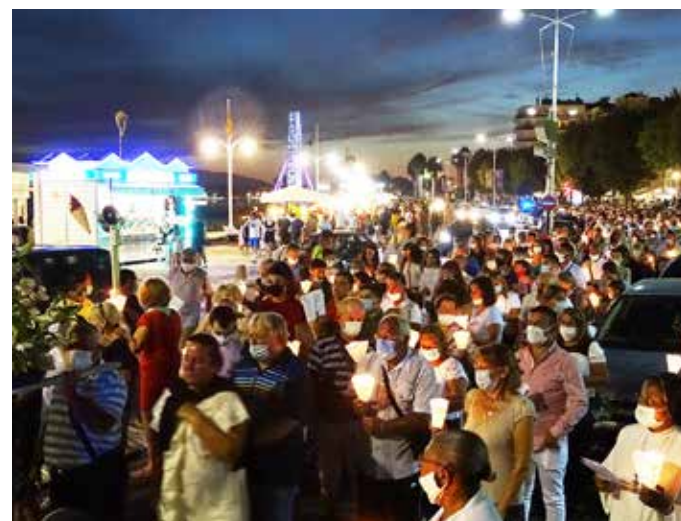
La procession est partie de la Basilique, longeant le bord de mer, sous le regard des touristes