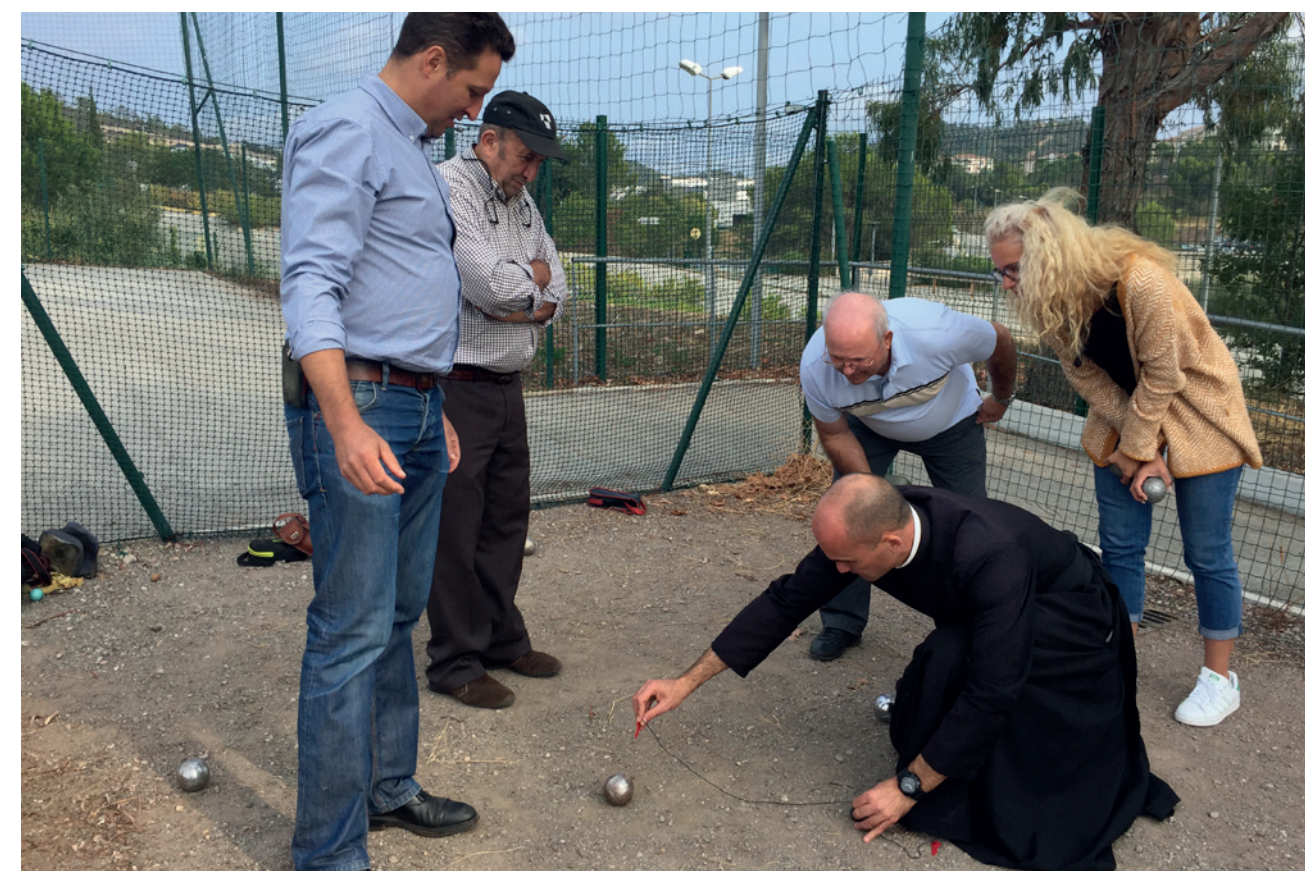
Rentrée de la famille paroissiale

Dimanche 1er octobre, jour de rentrée des guides d'Europe à Sainte-Bernadette, de nombreux paroissiens, dont beaucoup de familles, se retrouvent à l'Institut Stanislas pour un pique-nique partagé. Pendant le repas, les guides se rassemblent pour les nominations et pour accueillir les nouvelles recrues. Le café arrosé d'un digestif est servi par Don Stéphane et sert de mise en forme pour les nombreuses parties de boules qui vont suivre! Les vêpres chantées clôturent cette belle journée.