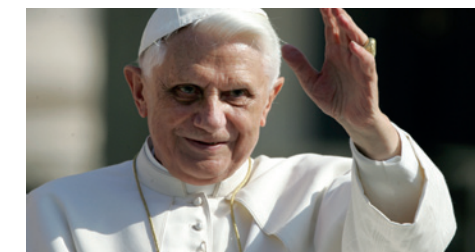
Benoît XVI Catéchèses sur la prière chrétienne

Chers frères et sœurs, apprenons à goûter, dans notre prière, la beauté d'être des amis, ou plutôt des enfants de Dieu, de pouvoir l'invoquer avec la familiarité et la confiance d'un petit enfant envers ses parents qui l'aiment. Ouvrons notre prière à l'action de l'Esprit Saint pour qu'il crie en nous : « Abba ! Père ! », et pour que notre prière transforme, convertisse constamment notre pensée et nos actions afin qu'elles soient toujours plus conformes à celles du Fils Unique, Jésus-Christ. Merci.