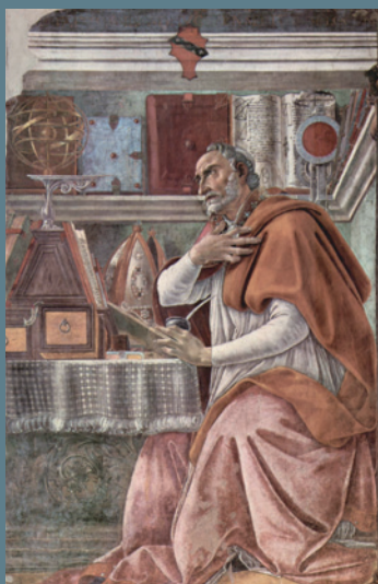
Saint Augustin (354-430)

De toutes mes forces, celles que tu m'as données, Je t'ai cherché, Désirant voir ce que j'ai cru. Et j'ai lutté, et j'ai souffert.