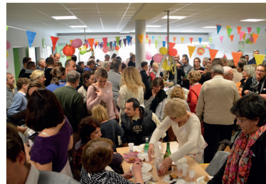
« Parrain d'Avent »

tage de l'ossature, sonorisation, création des costumes etc...), attire tous les passants devant la Basilique. Le lendemain soir, c'est à Sainte-Bernadette et Notre-Dame de la Paix que se déploie encore, plus modestement peut-être mais non sans talent, la créativité de nos scénaristes paroissiaux, au cours des veillées de Noël où les enfants revêtus de costumes pleins de fraîcheur font revivre de manière touchante les événements de la Nativité. Par ces célébrations empreintes de poésie et de tendresse, par la ferveur, aussi, des messes qui se succèdent, la veille et le jour même dans nos paroisses, Noël reste la fête du grand mystère du Dieu qui s'est fait homme dans l'humilité, et illumine les cœurs au-delà des paillettes de la fête commerciale qui envahit nos rues en cette occasion.